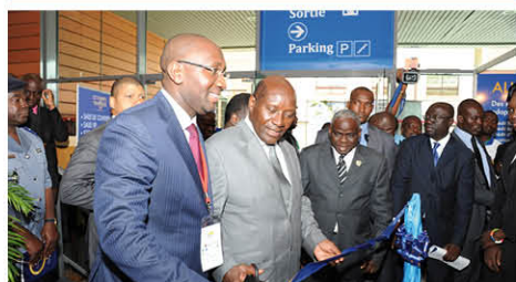
Coupe du ruban, ouvrant les expositions, par le Premier Ministre