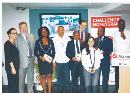
Photo des Lauréats