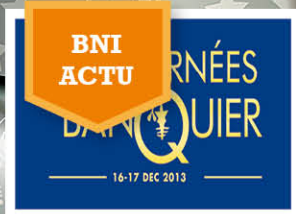
BNI ACTU Les Journées du Ban- quier