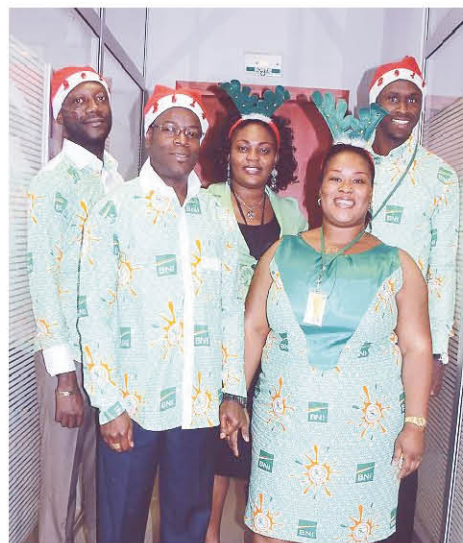
L'Equipe BNI Gagnoa