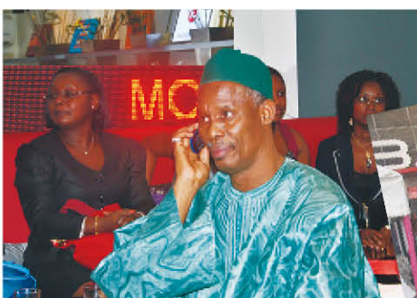
L'Imam de Biétry