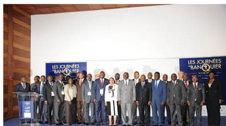
Photo de famille à l'issue de la cérémonie d'ouverture