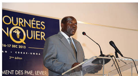
Intervention du 1er Ministre, Kablan DUNCAN