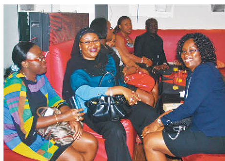
...venue soutenir les lauréats