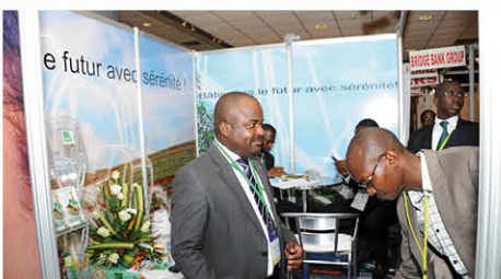
Le stand de la BNI