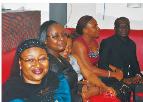
Une partie de la délégation de la BNI...