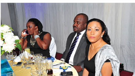
... des représentants...