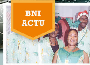
BNI ACTU 2 ème Anniversaire de l'Agence BNI - Gagnoa