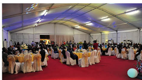
La salle du dîner gala