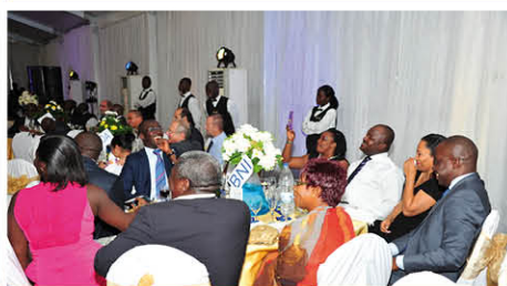
... de la BNI