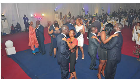
L'ouverture du bal